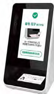
カード読み取り機

※令和6年秋の時点で有効期限が切れていない健康保険証は、その時点から最長1年間は有効に使用できます。