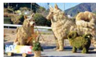
第1回市民遺産認定のジャンボ干支