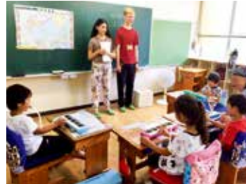
←湯日小学校の授業に参加