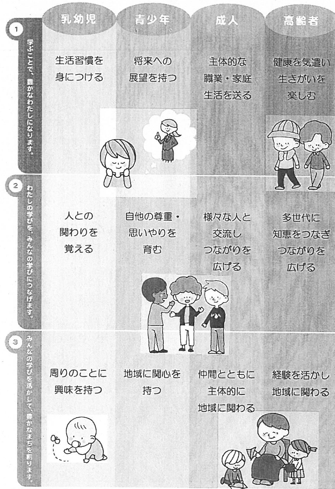
【図3】ライフステージにおける基本的な指針の例