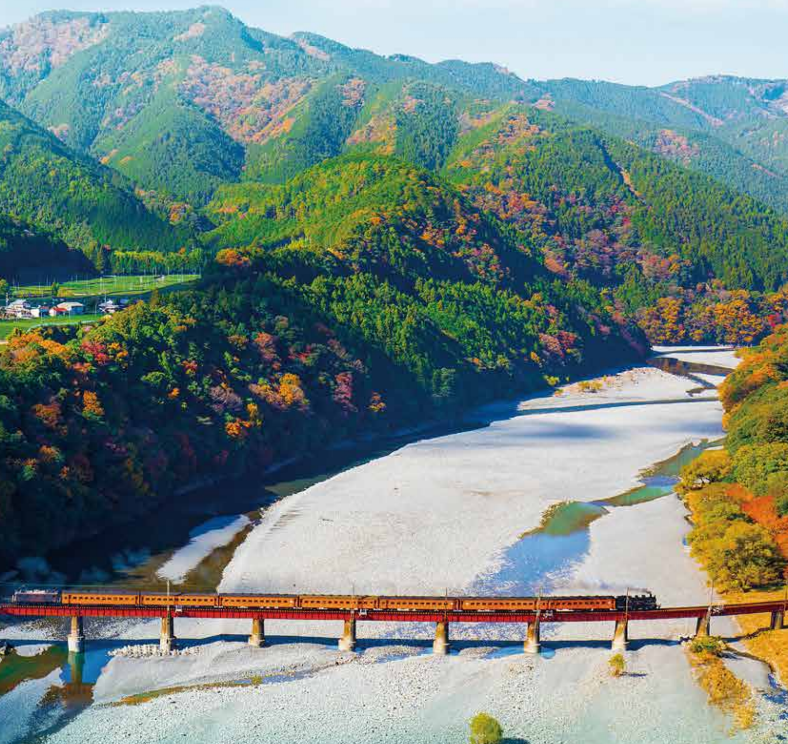
SLの汽笛がこだまする自然豊かな情景