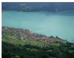
ブリエンツ町 (スイス連邦ベルン州) 1996年8月姉妹都市提携