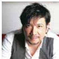
俳優 別所 哲也氏

島田市で生まれ育った著名な皆さんが、ふるさとの代表として島田市の魅力を各方面でPRしてください。