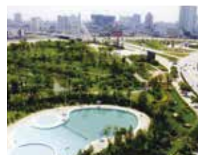
湖州市 (中華人民共和国浙江省) 1987年5月友好都市提携