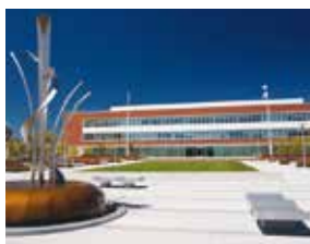
リッチモンド市 (アメリカ合衆国カリフォルニア州) 1961年12月姉妹都市提携