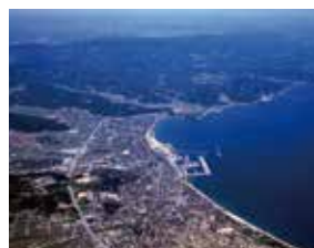
富山県氷見市 1987年4月姉妹都市提携