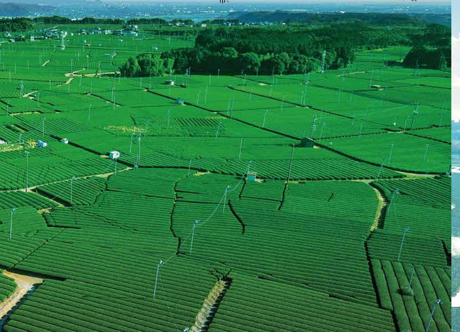
全国有数の広さを誇る大茶園