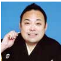
落語家 三遊亭遊喜氏