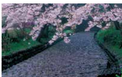
5 旧東海道石畳金谷坂