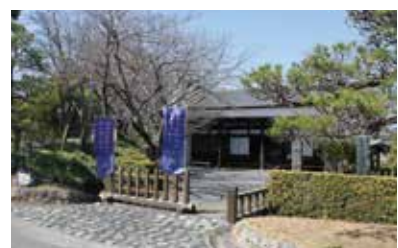
6 大井川川越遺跡(川会所)