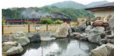
2 川根温泉ふれあいの泉