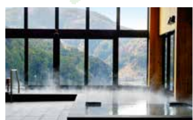
3 田代の郷温泉 伊太和里の湯