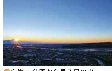
9 白岩寺公園から見る日の出