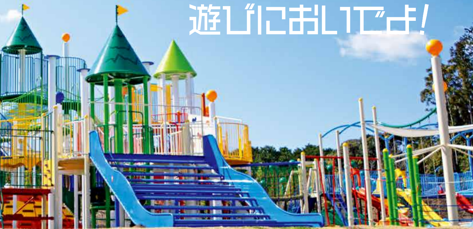
施設の写真は、施工中の状態です。オープン時と一部異なる部分があります。

子どもたちの成長段階に合わせて楽しめる遊具は、五感や好奇心を刺激し、冒険心をくすぐり、チャレンジする心を育みます。