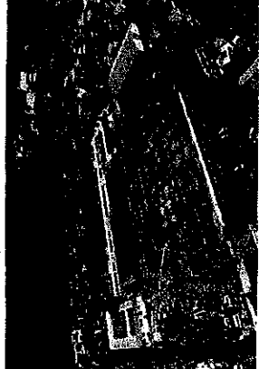
【島田第四小学校改築事業】