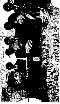
【島田原城跡ジオパーク構想式】