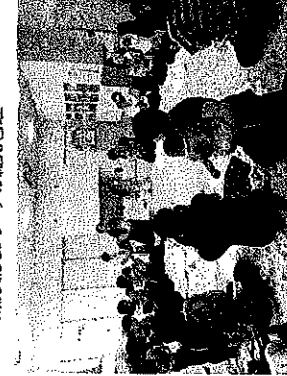
初めての遊具をもつ際の講座 (BPJ)