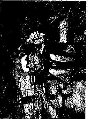
【伊豆川川で泳ぐ (サタチー・オーブンスクール)】