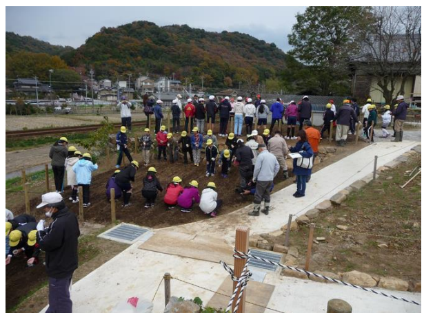
本陣跡広場北側の畑で「藤川まちづくり協議会」の指導のもと、地元の小学生がむらさき麦の種を播いている。