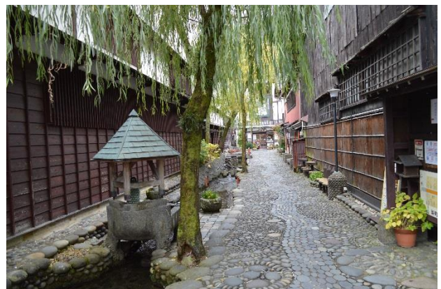
やなか水のこみち