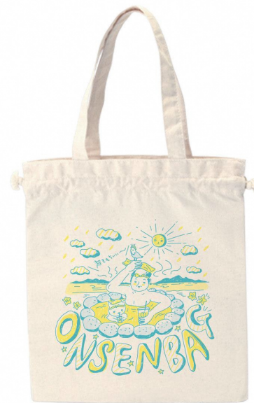
オープンイメージ