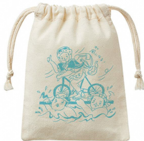
サイクリング人足