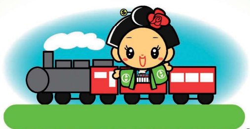
島田市商工会キャラクター 「おしまちゃん」