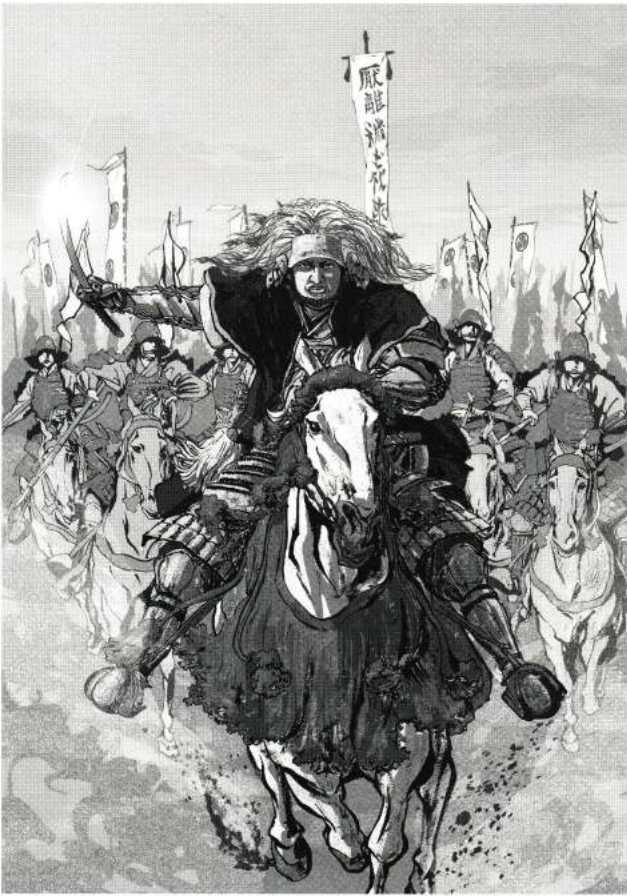
(1)新聞連載小説『家康/不惑篇』(安部龍太郎著)告知用イラスト

本企画展では、新聞連載小説『家康』(安部龍太郎著)の挿画をはじめ、オリジナル作品や、普段見ることのできない原画などを展示します。