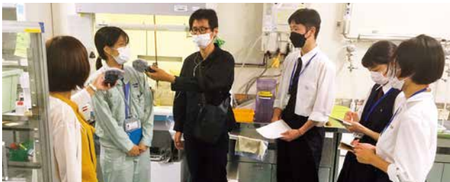
試験室を見学する高校生

第 6回目は、医薬品や化粧品の生産を行うアロエ製薬(株)を訪問。高校生は、製造現場や試験室を見学した後、会社の歴史や製品、社風などの説明を受け、普段店頭で並んでいる商品が、身近で製造されていることを知りました。また、厳格な品質管理のため、工場内の空気管理や社員教育を行っていることなどを、取材で聞き取りました。過去の放送内容は、市ホームページから聴くことができます。ぜひ、お聴きください。