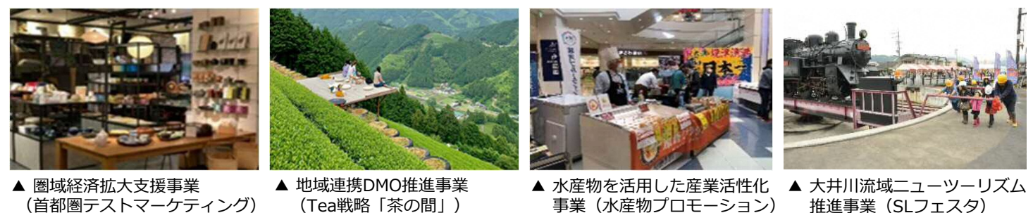
▲ 圏域経済拡大支援事業（首都圏テストマーケティング） ▲ 地域連携DMO推進事業（Tea戦略「茶の間」） ▲ 水産物を活用した産業活性化事業（水産物プロモーション） ▲ 大井川流域ニューツーリズム推進事業（SLフェスタ）