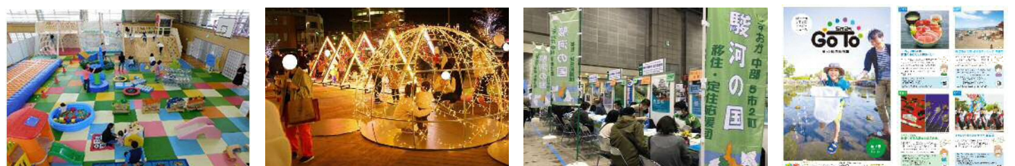
▲ 子育て支援事業（「れんげじ smilesホール」等の利用促進） ▲ JR駅前等賑わい創出事業（イルミネーションの点灯） ▲ 移住促進事業（移住フェアへの共同出展） ▲ 5市2町イベントニュース発行事業（「GOTO」）