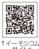
↑イーモシコムサイトへ