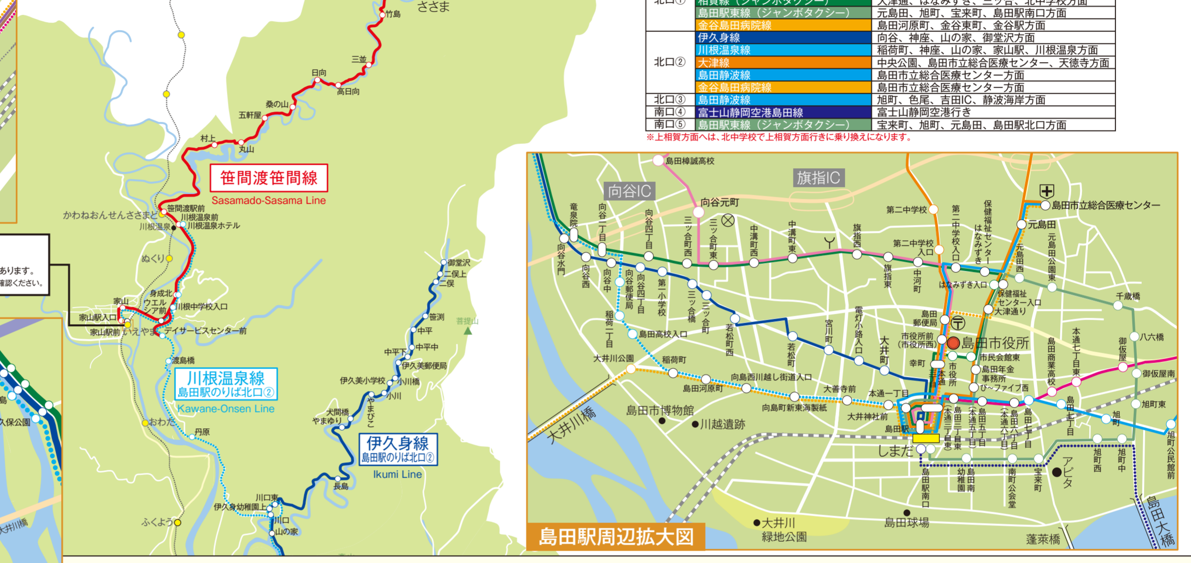
島田駅周辺拡大図