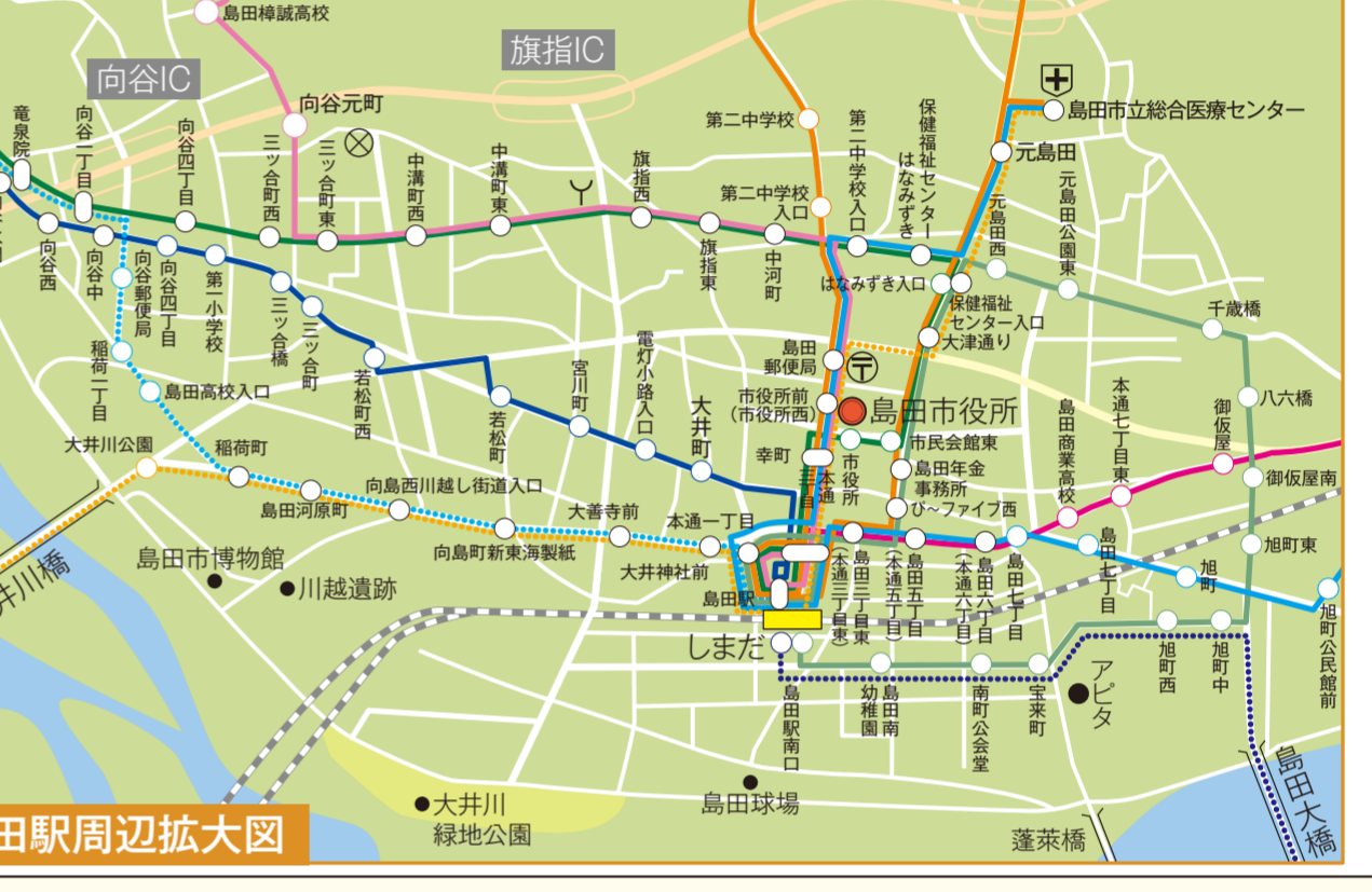
島田駅周辺拡大図