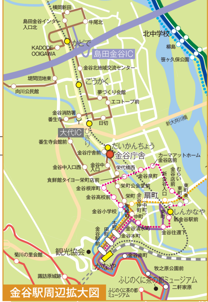
金谷駅周辺拡大図

川根温泉線とスクールバスとの乗継について ・家山駅前バス停にて、川根温泉線とスクールバスで乗継ができます。 ・スクールバスは4路線(市尾本線、一色上河内線、石風呂葛籠線、笹間線)があります。 ・スクールバスの時刻・運行日は、毎月川根支所などに配布するスクールバス時刻表でご確認ください。