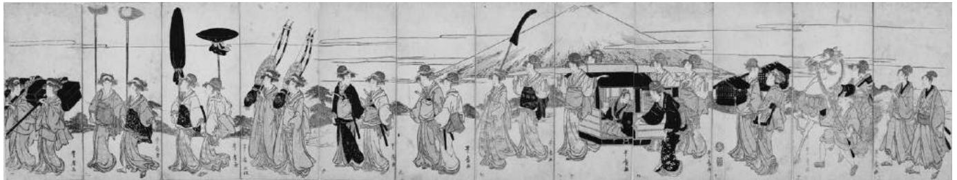
歌川豊広《東海道行列図》前期展示