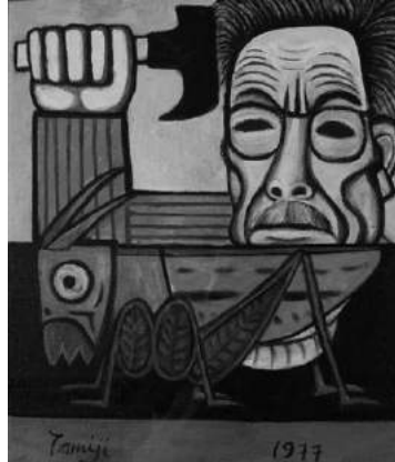
北川民次《バッタと自我像》