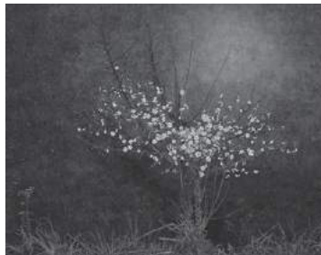
前原満夫《寒野梅》前期展示