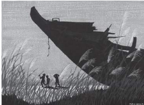
海野光弘《すすきと廃船》後期展示