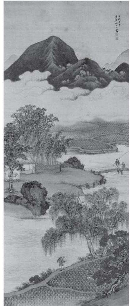
福田半香《春景耕作図》後期展示