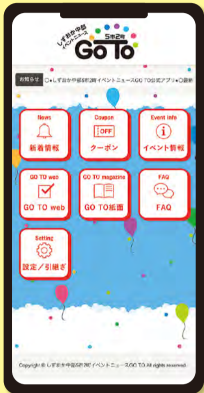
▲画面はイメージです。

しずおか中部5市2町イベントニュースGO TO公式アプリです。静岡市・島田市・焼津市・藤枝市・牧之原市・吉田町・川根本町のイベント情報等をお届けします。