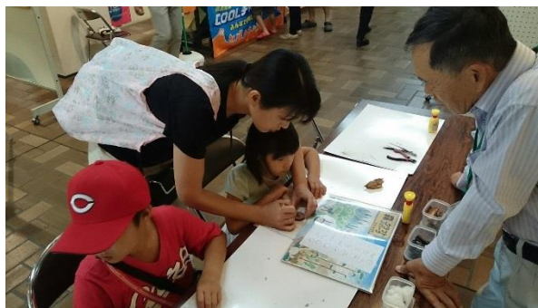
森のクラフトの様子