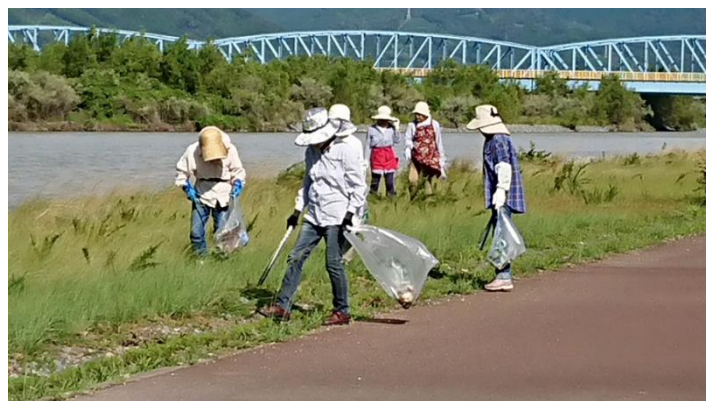
大井川河川敷にて清掃活動の様子