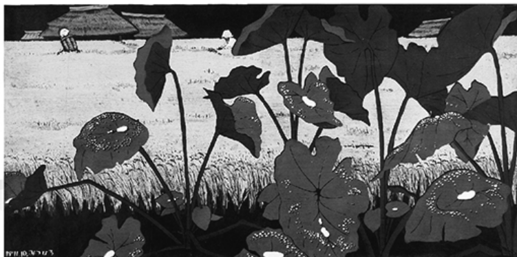
海野光弘 《秋露》 1971年 木版