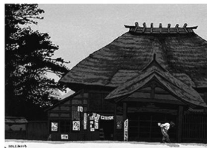
海野光弘 《よろずやの軒-3》 1974年 木版