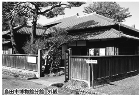
島田市博物館分館 外観