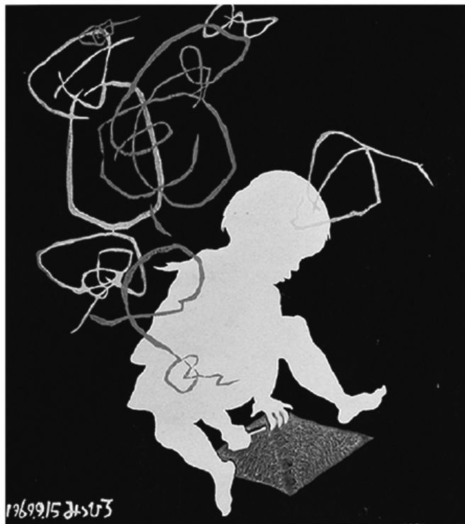
海野光弘 《らくがき》 1969年 木版