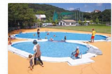
【かばさんプール】 保護者同伴で小学3年生以下の児童が利用できます。(7月~8月)