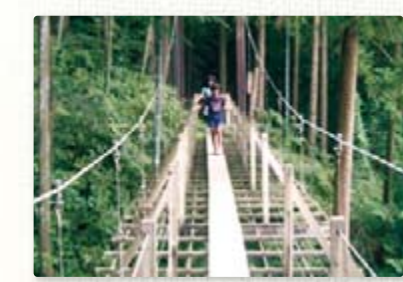
【つり橋】 幅30cmの板の上をゆらゆら渡ります。安全ですが、スリル満点。本格的つり橋です。