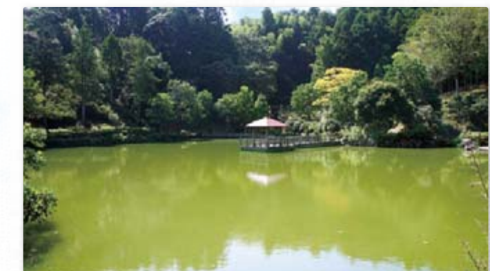
【鶴田沢の池】 公園西側にある池で、カモ・アヒル・コイ・カメ等が来園者を癒やしてくれます。季節毎新緑や紅葉が水面に映り、とてもきれいです。