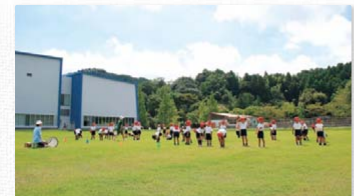
【ふれあい広場】 4,200㎡の広大なふれあい広場は、子ども達が歓声を上げて飛び跳ねています。