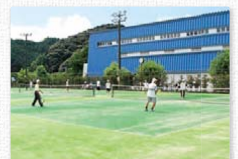
【テニスコート】 ローズアリーナの北側には、人工芝のテニスコートが4面あります。