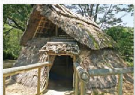
【古代の丘】 田ノ谷遺跡 弥生時代の住居跡をもとに設計復元した整立式住居です。