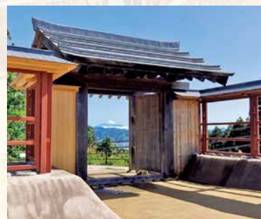
富士山を望める二の曲輪北馬出の門

市では、毎年城跡の整備を行っています。平成29年には、二の曲輪北馬出に門が復元され、現在はそこに付属する土塀の骨組みまで完成しています。案内看板の設置や見学路の整備など、今後も毎年整備を進めていきます。