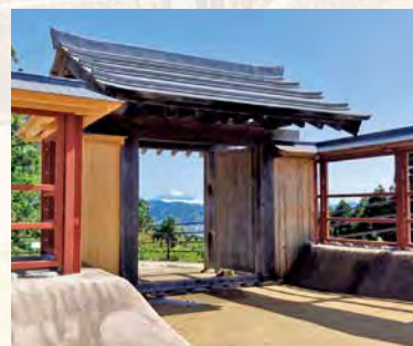
富士山を望める二の曲輪北馬出の門

市では、毎年城跡の整備を行っています。平成29年には、二の曲輪北馬出に門が復元され、現在はそこに付属する土塀の骨組みまで完成しています。案内看板の設置や見学路の整備など、今後も毎年整備を進めていきます。