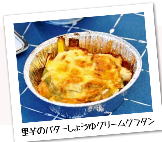
里芋のバターしょうゆクリームグラタン