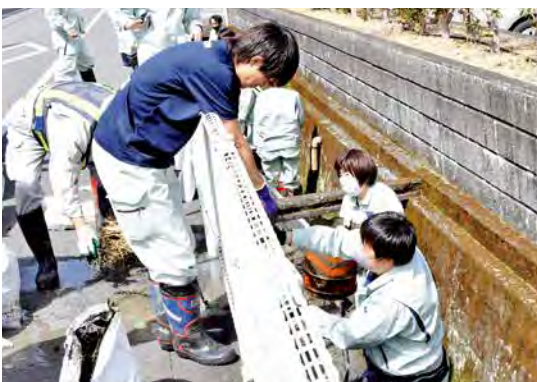
水路の清掃作業をする職員

市長をはじめ職員50人がスコップなどで水路にたまった泥やゴミを取り除き、手際よく土のう袋に詰めていきました。約1時間の作業で、回収された土砂はおよそ200袋。河川を本来の状態に戻すことができました。今後も美しい河川環境の維持に努めていきます。