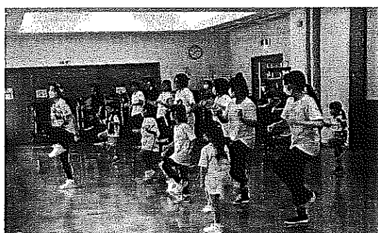
エンジョイ！ ZUMBA（ズンバ）（1日講座）

島田市北部ふれあいセンター 島田市神座397番地の1 Tel. : 32-1100 FAX : 32-1102