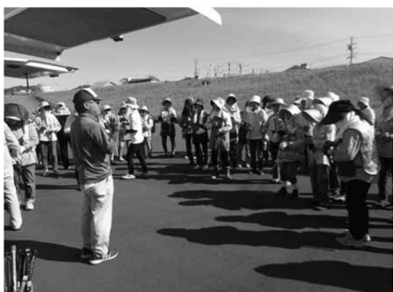
大井川河川敷にて清掃活動の様子