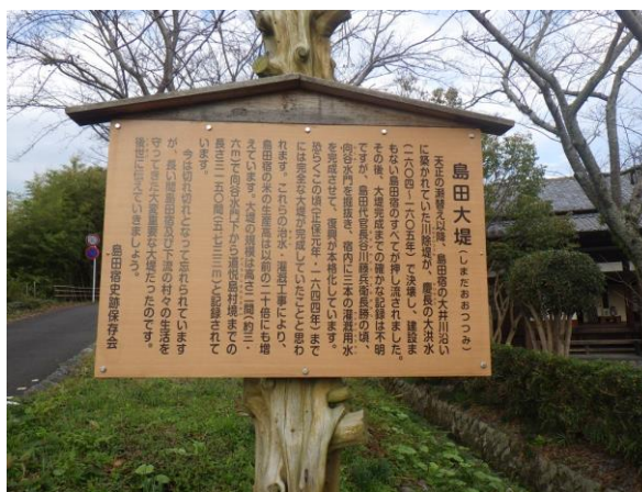
島田大堤の説明板