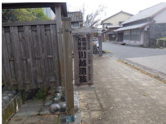
川越街道の西側標識