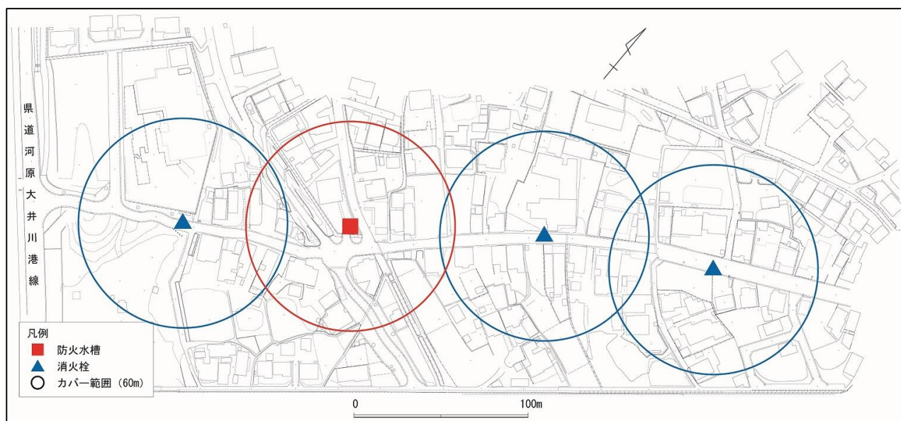
図38 消防水利図（防火水槽・消火栓位置図）

自動火災報知設備や消火器、消火栓などの防火設備の点検・調査を行い、不足している箇所への整備を推進する。(自動火災報知設備、消火器および可搬消防ポンプなど)