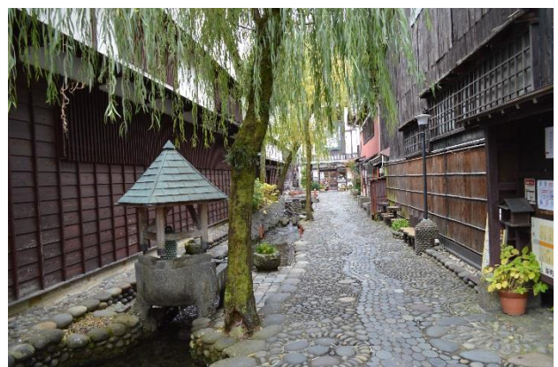
やなか水のこみち