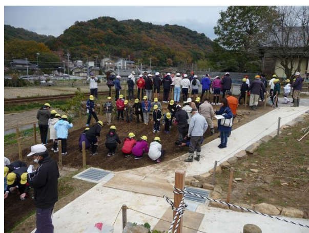
本陣跡広場北側の畑で「藤川まちづくり協議会」の指導のもと、地元の小学生がむらさき麦の種を播いている。