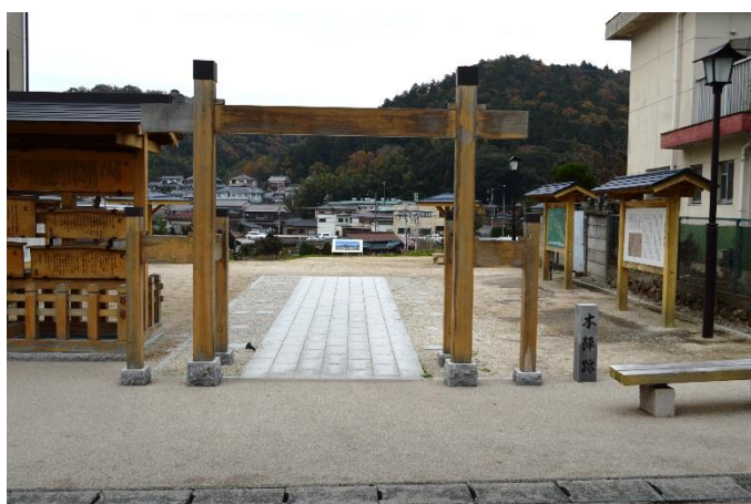
藤川宿本陣跡広場