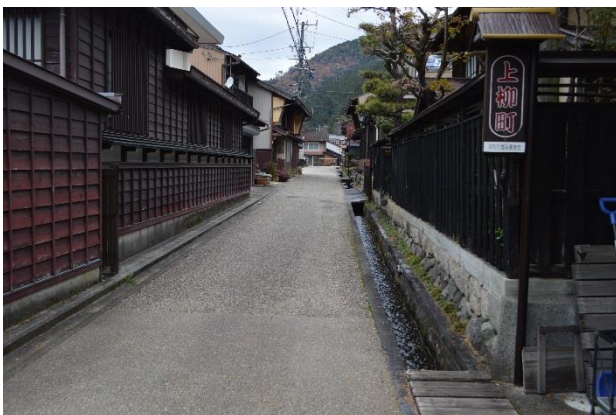
郡上八幡北町伝統的建造物群保存地区