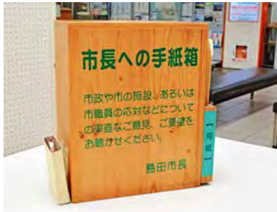
市長への手紙受付箱(本庁舎1階)

毎日のように届く市長への手紙には「どうせ市長は読まない」などの記述を見かける時があります。皆さんがそのように思っておられるとしたらとても残念です。昨年度は304通の市長への手紙をいただき、すべての手紙(又はメール)を拝読しています。