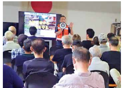
市内自主防災会の防災訓練

地域とのつながりは、一概に面倒なことばかりではありません。楽しい行事や交流もたくさんあり、顔の見える関係が、あなたやあなたの家族を守ってくれるはずです。昔の「当たりまえ」は通用しない時代、どうすれば誰もが安心して住み続けられる地域を創れるのか。自問自答を繰り返し、日々真剣に考えています。