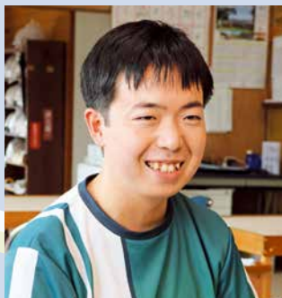
プロeスポーツプレイヤー 看護師

多くの高齢者にとって、eスポーツは新しい体験です。馴染みのないものに挑戦することは、脳に刺激を与えてくれます。これを通いの場などで取り入れることは、人とのコミュニケーションを取る機会が増え、地域の活性化にもつながると思います。初めは難しく感じるかもしれませんが、まずは一度、体験してもらいたいですね。