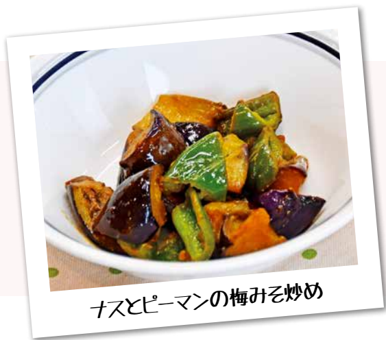
【協力】島田市健康づくり食生活推進協議会

とき／8月22日(火) 午前10時～正午 ところ／保健福祉センターはなみずき 運動室(3階) 対象／65歳以上で興味のある市民 定員／10人 持ち物／眼鏡(必要な人) 申し込み／電話で問い合わせ先へ 内容／プロのeスポーツゲームの指導で、家庭用ゲーム「太鼓の達人 ドンダフルフェスティバル」などを体験 包括ケア推進課 ☎ 34-3288