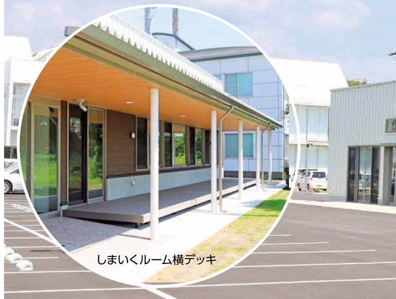
しまいくルーム横デッキ