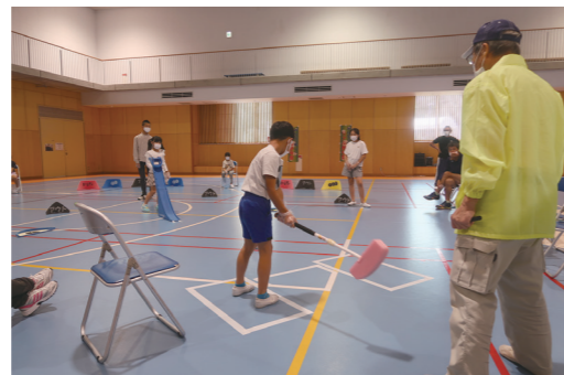
『しまだパラスポーツパーク』