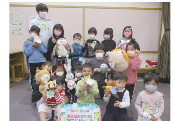
『ぬいぐるみの図書館おとまり会』