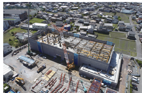
島田第一小学校校舎等建設工事の様子