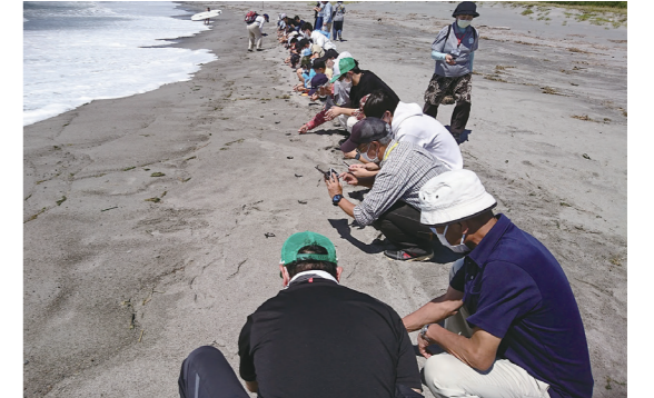
『しまだガンバ!ウミガメの放流体験』