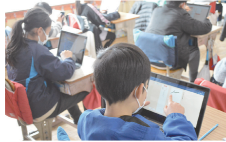
『端末活用 ドリル学習』