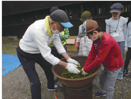
『サタデーオープンスクール』