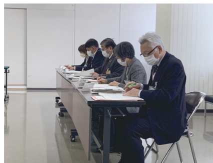
定例教育委員会の様子