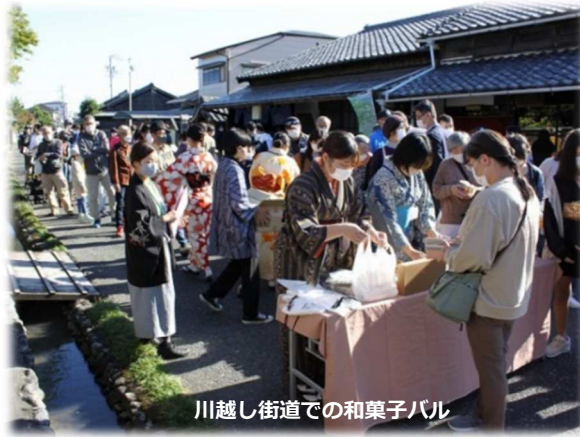
川越し街道での和菓子バル