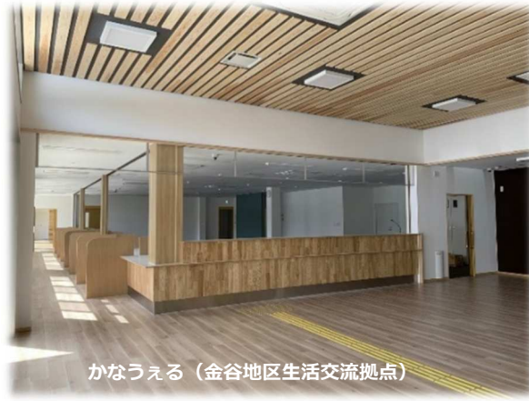
かなうえる (金谷地区生活交流拠点)