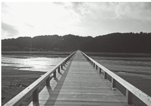
蓬莱橋左岸側から右岸側を望む

A 国土交通省と当市で行っていく。 国土交通省は河川管理のための 管理用の道路など、市は広場、 トイレ、蓬莱橋を含めた農道な どの管理を行う。市が管理する 部分は、民間事業者や地元住民 団体などに委ねることも可能な ため、連携を視野に入れて検討 していきたい。