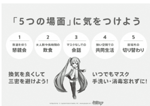
感染リスクが高まる5つの場面 (内閣官房)