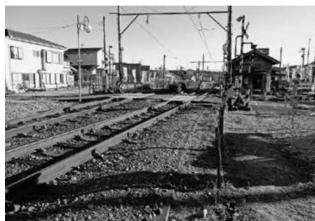
五和駅（現合格駅）構内踏切拡幅工事予定地

A 公共施設マネジメント民間提案型運用指針に基づいて公募・審査した結果、合同会社ビアホップおおいがわの提案が採択された。事業名は「いくみローカルクラフトビール事業」でクラフトビールの製造・販売、マルシェ、バーベキューハウス、地元農産物の販売ショップを計画している。