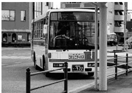
市内を走るコミュニティバス