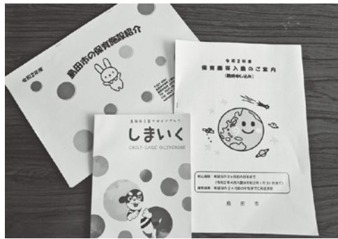
希望者全員が希望する保育園に入れるように

とに見直され、引き上げられてきた。支払準備基金約9億円を使い、第8期の介護保険料を引き下げるべきではないか。