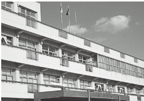
新庁舎建設を前にした現市役所

A 島田第一小学校は、敷地の面積の関係で木造校舎の建設は難しい。新校舎については、校舎の床や腰壁、間仕切り等に木材を利用し、木質化を予定している。