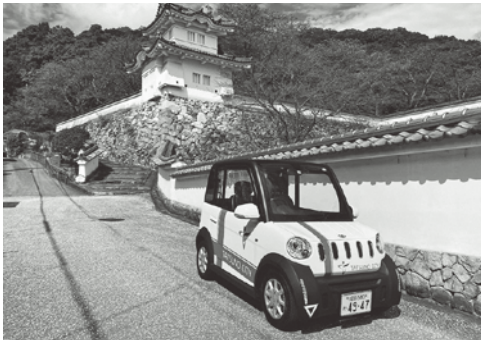
兵庫県たつの市が導入した超小型電気自動車

A 現時点において、公共施設に充電スタンドを設置する計画はないが、国から脱炭素社会に向け