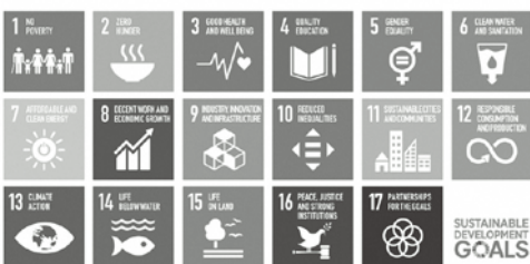
持続可能な社会を目指そう

A 空調機器の一部に地下水熱を活用する。また、西風を積極的に取り込み、空調負荷の軽減を図り、感染症対策の機能を併せ持つ設備の導入を計画している。