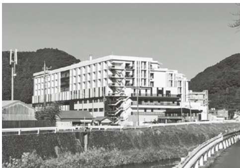
東側から見た新市民病院の全景

Q 新市民病院の開院はいつか。 A 開院は5月2日、外来の一般診療の開始は、5月6日を予定。