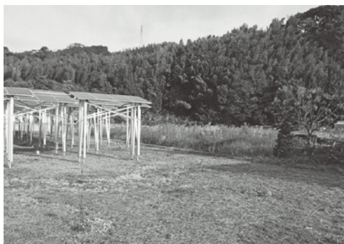
荒廃農地の対策は今後どうしていくのか