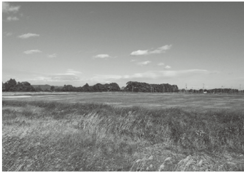
利活用が低迷している旧金中跡地！