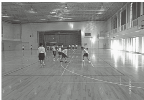
中学校の部活は今のままで良いのか

A 地域の人材を生かし運動部、文化部共にマッチングを進めており、コミュニティ・スクールも含め考えていきたい。