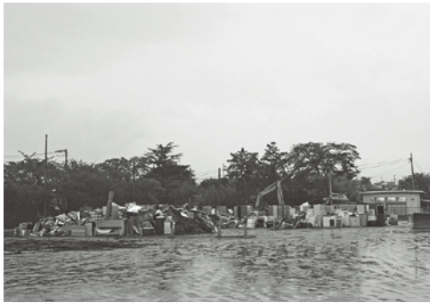
山積みされた水害廃棄物（函南町）

A 必要性は認識しているが、課題 が多く模索中である。市内民間 業者への処理拡大を求める。