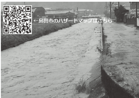
増水時の東光寺谷川（令和元年10月12日）

Q 国が想定している大井川水系の浸水予測と市のハザードマップとは、浸水箇所や水深の値に違いがあるがなぜか。