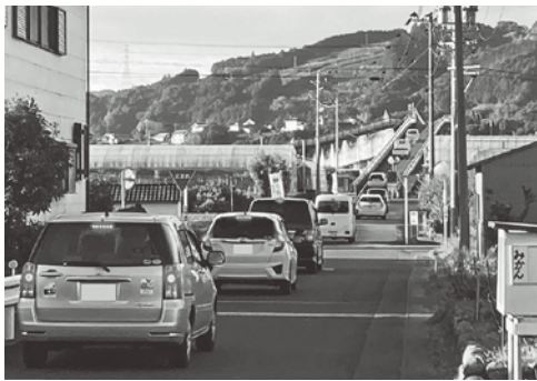
毎朝多くの車が通過する大井川水路橋