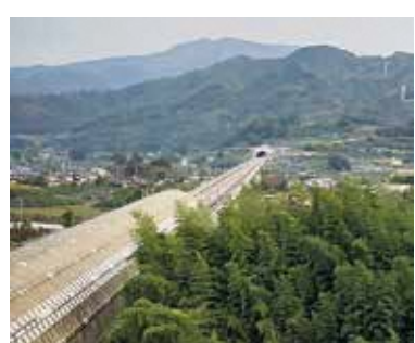
山梨リニア実験線

令和2年10月28日（水）に全議員で山梨県笛吹市を訪問し、リニア中央新幹線山梨リニア実験線トンネル工事による一部河川が水枯れを起こした実態の視察を行いました。笛吹市議会から、リニア対策特別委員会委員長による説明を受けた後、現場にも立ち寄り説明を受けました。視察では水枯れした地区の水の処置方法、国の支援機構からの補償、電磁波による健康問題や生態系への影響、関係住民とJRとの交渉経過、今後の問題点など多岐にわたる視点から質疑を行いました。