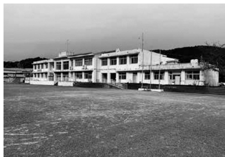
跡地利用が検討中の湯日小学校