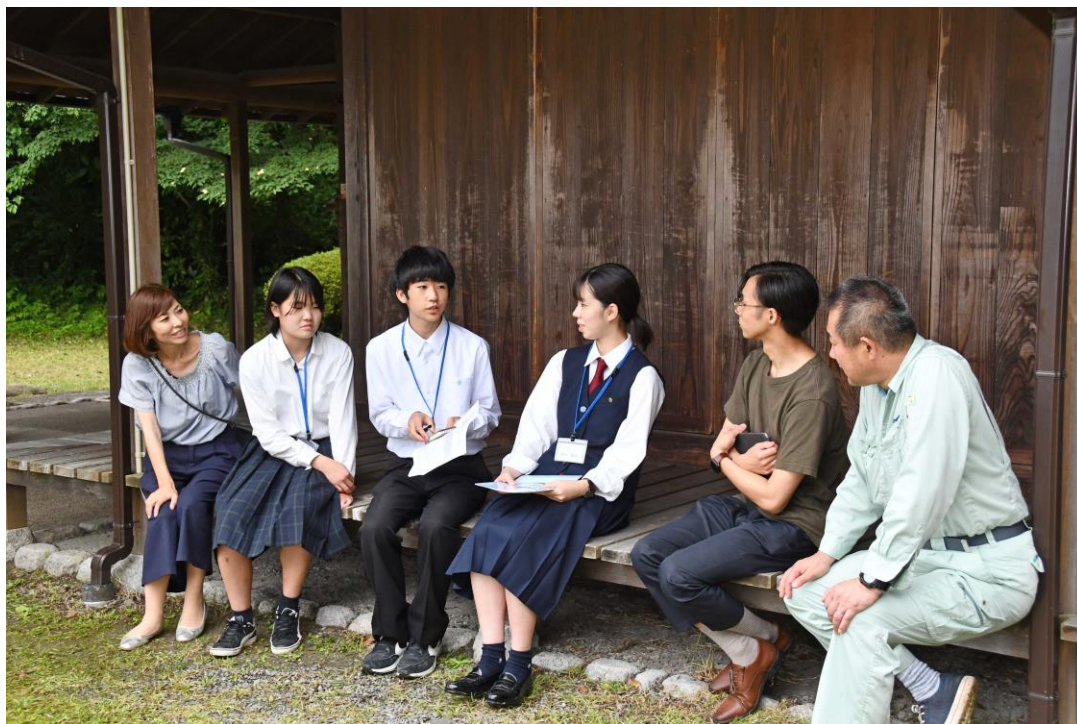
東海道金谷宿お休み処「石畳茶屋縁-en-」の縁側にて仕事を取材