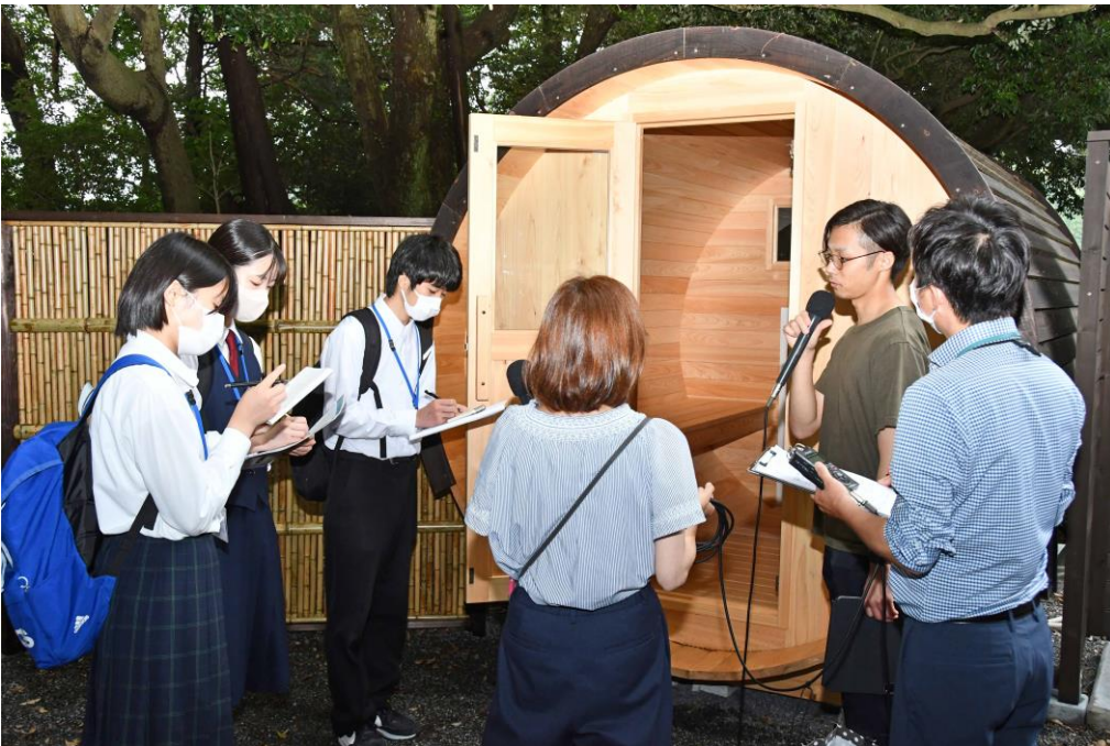
7月グランドオープン予定の 東海道金谷宿お休み処 「石畳茶屋縁-en-」に設置 されるバレルサウナを見学

回答：この付近には気軽に集まれる「居場所」が少ないため、あえて共通点が少ないものを取り入れて、様々な人に来てもらい、「みんなの居場所」となってほしいと思っています。