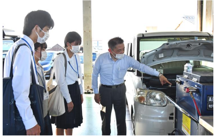
新車の整備について、説明を受けているところです。

回答：エンジンの分解作業です。 3,000点の部品で構成されるので慎重に作業をしなければなりません。 でも、それができるととてもやりがいを感じます。