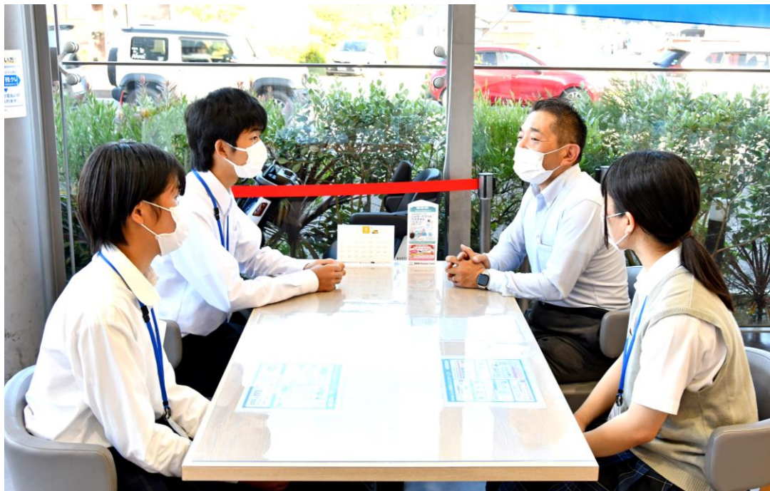
店舗内でご説明いただきました。