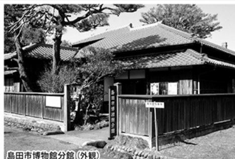
島田市博物館分館(外観)