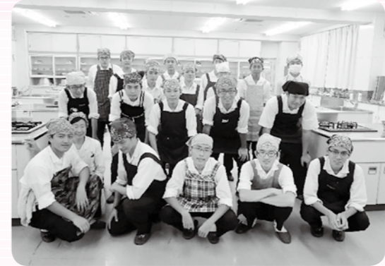
部員数24人の文化部最大の部活!