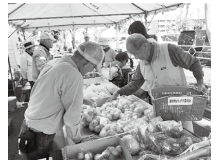
耕作放棄地で作った自慢の野菜！

朝市では野菜の販売だけではなく、幼稚園の太鼓演奏などのイベントや縁日もやっている。少しずつお客さんも増えて、