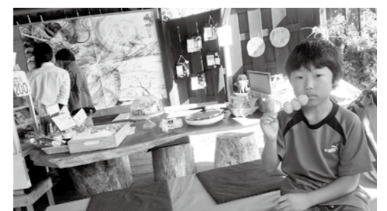
名物は江戸珈琲。玉こんにゃくは絶品!!

もっと人の集う、世代を超えて交流できる場所にしたい。30代メンバー募集中。子どもたちも地域の人も巻き込んで、一緒に盛り上げていきたい。