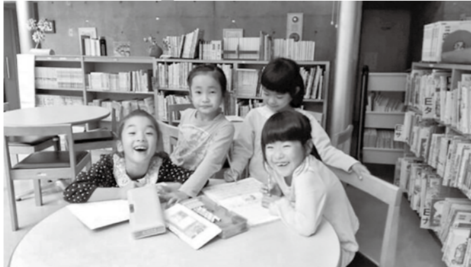
思い思いの場所でまずは宿題

母親達から、湯日にも「放課後児童クラブ」が欲しいネ！…という声。その要望のもと、平成27年7月に「湯日の子どもたちを見守る会」が設立されました。