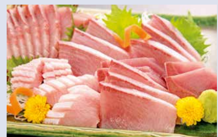
氷見のぶり料理 (イメージ)

※詳しくは、ホームページから「ひみぶりフェア特設ページ」をご覧ください。 ☎ひみぶりフェア実行委員会(氷見市観光協会) ☎0766-74-5250