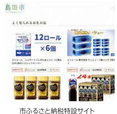
市ふるさと納税特設サイト

ふるさと納税で集めたお金で市町に新しい施設ができたり、給食費の無償化に充てたりという話題も耳にしますが、ふるさと納税は恒久的な制度ではありませんので、経常的な歳出に充てるのは慎重にすべきと考えます。その上で、魅力ある返礼品を掘り起こし、地場産品の販路拡大を図り、島田市をもっとPRできるよう、組織を挙げて尽力してまいります。