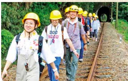
「線路ハイキング」で新たな大井川鐵道の楽しみ方を体験する参加者

「当社最大の売りは、随所で感じる昭和レトロ。それが令和の暮らしに自然と存在することで、この地域ならではの風景を作り出します。いつかSLを各駅停車にして『SLで通学しました！』と、誇らしく話す学生が現れたらと夢を描いています。被災後の当社には、皆さまから数多くの励ましの声が届きました。その一つ一つには、この地域の誇りとして『これからも走り続けてほしい』という期待が込められています。そのないかと感じています。その期待に応えるためには、大井川鐵道にしかできないことに磨きをかけ、流域の魅力を発信し、一人でも多くのお客さまに乗りいただくことが必要です。これからも、この地域の誇りとして走り続けます」 未来を見据え、力強く語る加冷さん。溢れんばかりの大鉄愛から生み出されるアイデアによって、これからも沿線に笑顔運びます。