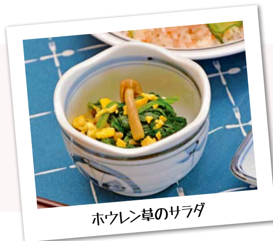
ホウレン草のサラダ