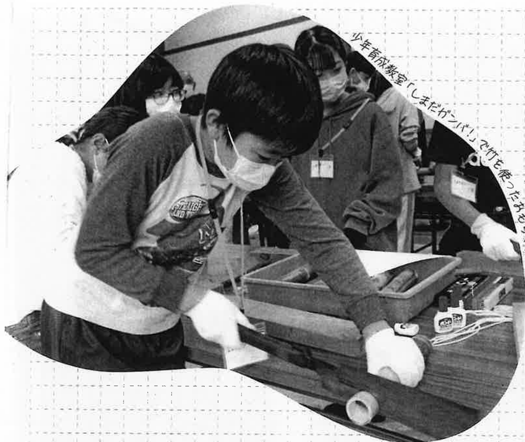
少年育成教室「しまだガンバリ」で竹を使ったおもちゃ作り