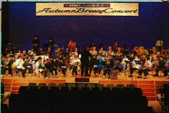
オータムブリーズコンサート