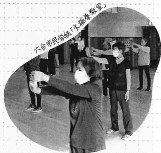
六合市民学級「水極楽教室」

「私が参加した『しまだガンバリ』では、学校の授業では学べないことを経験しました。自分も大きくなったら、小さな子どもたちに色々なことを教えてあげたいです」