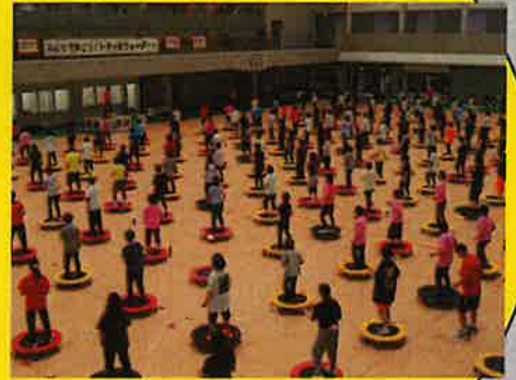
トランポウオーク