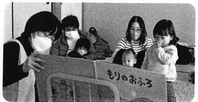
乳幼児向けの読み聞かせ教室「お話の会」