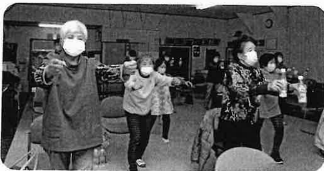
介護予防体操「しまとれ」