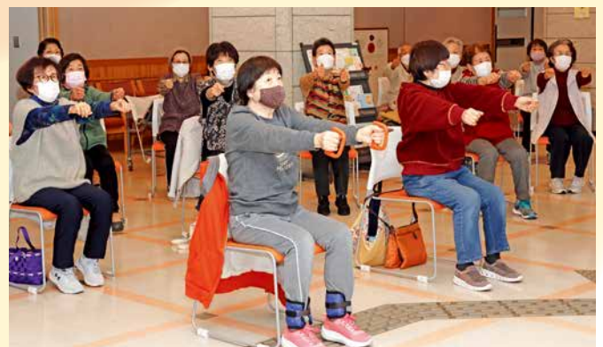
保健福祉センターはなみずきの「しまトレ」