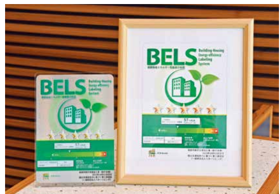
エネルギー消費量の削減率が明記された認証プレート

この認証は、国土交通省が定めるエネルギー消費量の基準から50%以上を削減する建物に与えられるもの。本庁舎は、設計段階から経済的・効率的で環境に配慮した建物として整備を進めてきました。公共建築物の率先した取り組みとして、脱炭素社会の実現に貢献していきます。