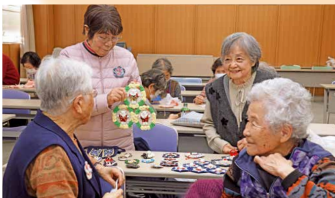
「ふれあい」で手芸を楽しむ参加者（ひまわりの会）