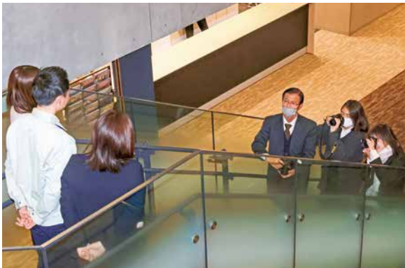
市職員を撮影する静岡学園高校写真部(右)

当日は、若手職員有志によるグループ「島田市で働く魅力PRプロジェクト」のメンバー17人と写真部の生徒4人が参加。市役所庁舎内で撮影を行いました。同プロジェクトでは、職員・庁舎・仕事風景などをSNSで発信しています。撮影した写真は、市ホームページや人事課公式X(旧Twitter)・Instagramなどでも使用する予定です。