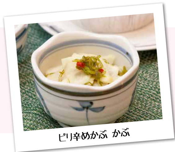
ピリ辛めかぶ かぶ