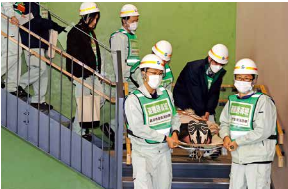
負傷者を運ぶ訓練をする職員

職員で組織する自衛消防隊を中心に火災が起きた想定で、通報手順、消火器・消火栓の使い方、避難経路の確認や誘導方法、救護の仕方などを確認。また、煙体験ハウスを使った脱出や、救助袋での降下、AEDやトリアージタグの取り扱い訓練を行いました。今後も、消防機関と連携し、有事の際の初動対応の役割を確実に実行できるように職員の危機意識向上に努めていきます。