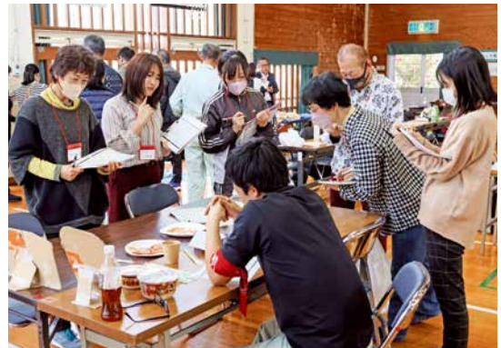
避難所を再現したブースで課題を探す参加者

研修は、内閣府が災害関連死を減らすため、全国で実施しています。防災に関心のある大学生や介護職員、市職員など計41人が参加。被災者とのコミュニケーションや避難所の環境を向上するスキルを学びました。実地では、避難所を再現したブースを設け、具体的な改善点を話し合う演習などが行われました。