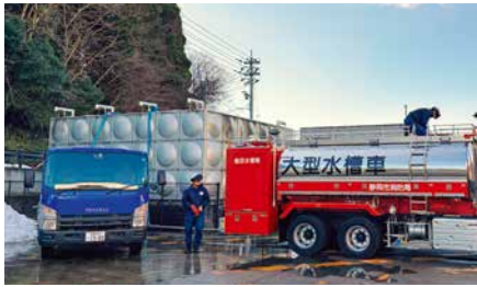
氷見市で給水作業を行う派遣職員

当市は、地震発災直後から姉妹都市提携を締結している富山県氷見市と連絡を取り合い、いち早く9tの大型水槽車と4tの給水車を現地に派遣し、断水が続く金沢医科大学氷見市民病院などへの給水活動を支援しました。現在は、主に石川県穴水町への支援に注力し、DMAT（災害派遣医療チーム）、住家被害認定調査、下水道被害調査、トイレカー派遣などの支援を実施しています。また二次避難所として市営住宅の提供も申し出ています。