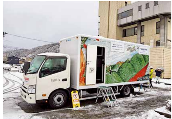
雪が積もる被災地に設置された本市のトイレカー

任務を終えた4人は1月15日、現地の様子を市長に報告。プライバシーの確保が困難な生活の長期化で、避難者のストレス過多が課題になる中、個室利用のできるトイレカーは、生活環境を向上させ、感謝されたと報告しました。引き続き、トイレカーや職員の派遣などにより、被災地を支援します。