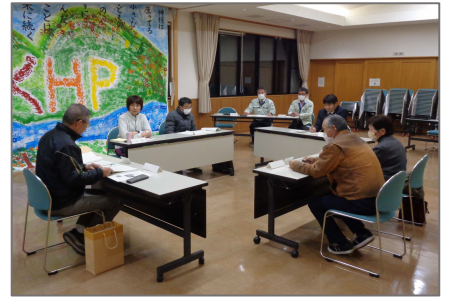
この会議の内容は、市の公式ホームページからでもご覧いただくことができます