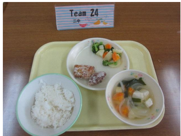
島二中 カレー 2 4 竜田揚げ・あっさり 2 4 サラダ 2 4 スープ (具たくさん島田汁)