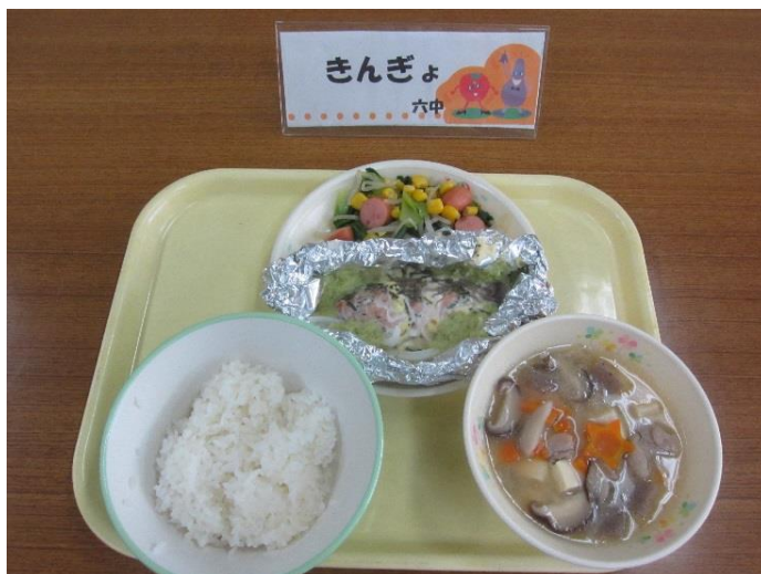
六合中 森のマヨサーモン・ベジタブルソテー スタミナキラキラ島田汁