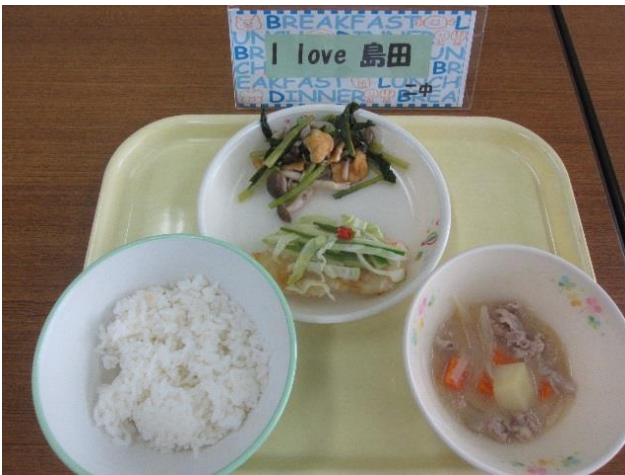
島二中 白身魚の南蛮漬け・小松菜と油揚げと しめじの煮浸し