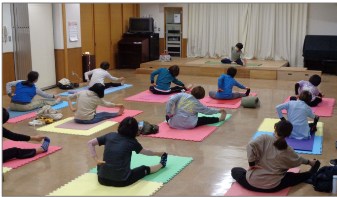
「とてもリラックスできる」「いい自分時間ができている」