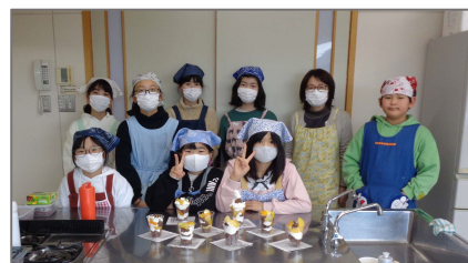
「みんなとお話ししながらできた」「ママとパパにもほめてもらったのでよかった」