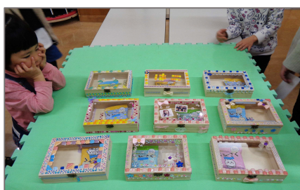
「楽しかった」「いろいろな物がつくれた」「毎月季節のものを部屋に飾れる」