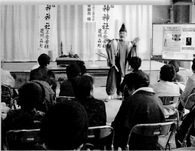
高齢者学級：講演会