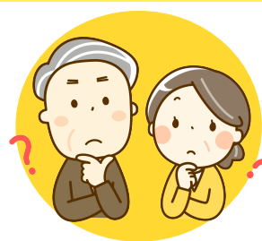
介助方法のアドバイス