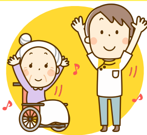
自主トレのアドバイス