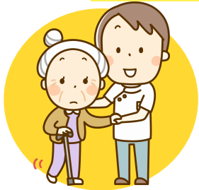
歩行や生活動作の練習