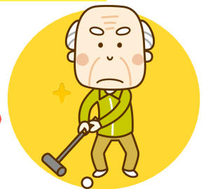
趣味や外出のための練習