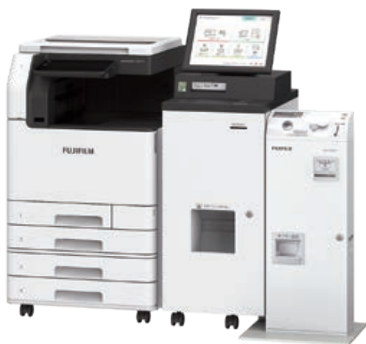
証明書交付用キオスク端末