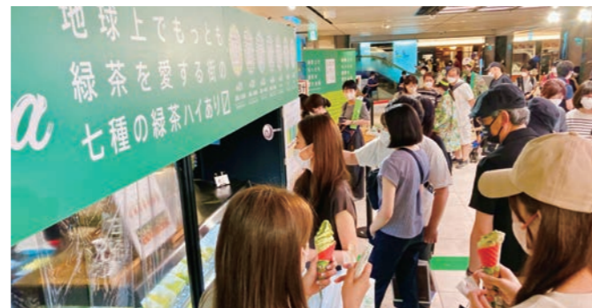
令和4年に東京駅で開催された「緑茶緑日」