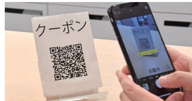
デジタル商品券(イメージ)