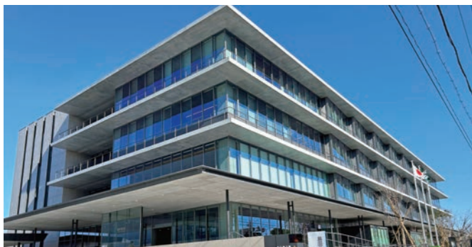
大井川の恵みを生かした新庁舎