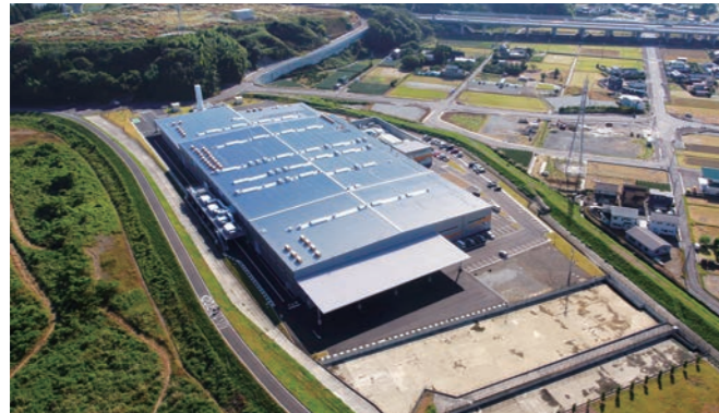
ふじのくにフロンティア推進区域整備事業