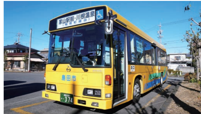
コミュニティバス