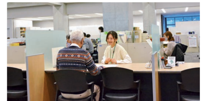
福祉課職員による相談受付