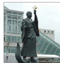
栄西禅師像(島田駅北口)

その年最初の新芽で作られた新茶は滋養に富み、また、末広がりの「八」が重なる八十八夜に摘まれた新茶は無病息災の縁起物です。茶どころ島田の新茶、今年も楽しみですね！