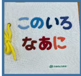
「このいろなあに?」 (公財)ふきのとう文庫(北海道)