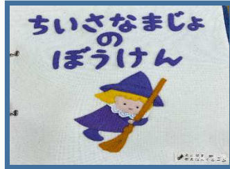
「ちいさなまじよのぼうけん」初公開! よこはま布絵本グループ(神奈川県)