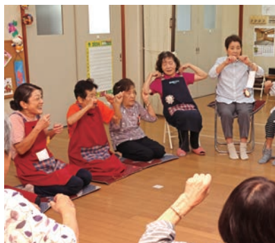
地域のふれあい活動