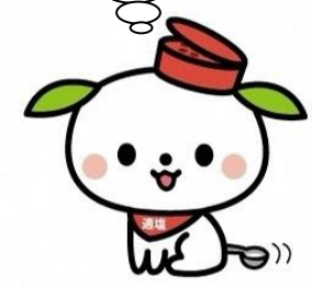
島田市 「ヘルしろろ」