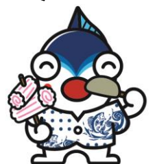
焼津市 「やいちゃん」