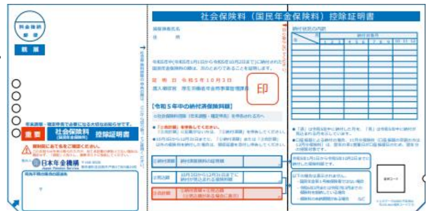
社会保険料（国民年金保険料）控除証明書見本

国民年金保険料は、所得税及び住民税の申告において全額が社会保険料控除の対象となります。この社会保険料控除を受けるためには、支払ったことを証明する書類の添付が義務付けられています。令和6年1月1日から令和6年9月30日までの間に国民年金保険料を納付された人については、令和6年11月上旬に日本年金機構から控除証明書が送付されますので、年末調整や確定申告の際には必ずこの証明書（または領収証書）を添付してください。令和6年10月1日から令和6年12月31日までの間に今年始めて国民年金保険料を納付された人については、令和7年2月上旬に送付されます。なお、ご家族の国民年金保険料を納付された場合も、ご本人の社会保険料控除に加えることができます。詳しくは税務署にお問合せください。