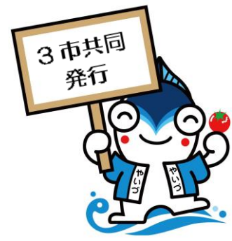
焼津市 「やいちゃん」

日本国内に住所がある20歳以上60歳未満の人は全員が国民年金に加入します。 国民年金の種別が変更になったら、年金記録をつなぐためにも忘れずに届出をしましょう。 必要な書類などについては、届出先にお問合せください。